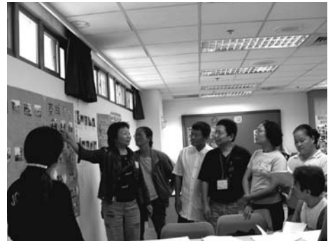
自信可以使我們更有雅量與發揮的空間

愈有自信的人，就要有更坦然承認成員工作能力的胸懷。愈能夠接受這個事實，才不會把它當成是一種威脅，進而發揮同舟共濟一起向前的力量。同樣的道理，自信可以使我們更有雅量與發揮的空間。當我們明瞭工作夥伴的能力、經驗與專長，在派任工作時，才不會任意分派，會做更妥善的安排，這種安排與處理方式，將會讓我們的團體順利且圓滿的達成任務，才不會在人力資源上做無謂的耗損。