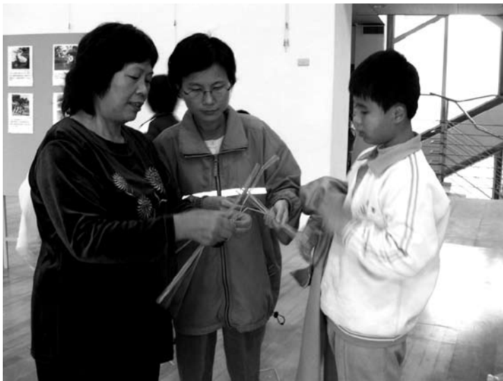
讓具有不同專長的居民都有參與活動的機會

動員的方式很多，以大二結為例，促進會在籌備初期便選擇在暑假辦理青少年活動，作為推動社區營造工作的切入點。或許因為沒有投票權，社區青少年長期以來一直無法獲得地方民代的關懷，沒有針對他們的需要所舉辦的活動，也缺乏得以參與社區事務的管道。為了提供青少年一個可以去的場所或可以參與的活動，促進會在取得學進國小校方的同意下，主動修復早已不堪使用的籃球架，邀請籃球教練義務指導，重新把這些青少年找回來，並在暑假期間為這群青少年辦了一場三對三鬥牛賽。這項活動獲得青少年的熱烈參與和社區居民的肯定，同時也改變了青少年對社區活動參與的態度，為他們日後積