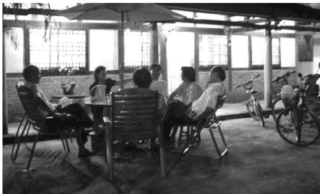
燈光美氣氛佳！適合一起做社區發展美夢。

有一種社區，社區活動多樣且居民參與熱烈，雇工購料操作確實，社區環境改善效果卓著，社區經營歷史悠久經常得獎，常吸引各地團隊參觀，但卻令專家學者忍不住要擔心，尤其擔心社區的永續發展，這一類社區大都有一位強勢或熱心的領導者，他照顧大多數人的需求，衆人也唯其馬首是瞻，大家應該可以猜得到，那就是所謂的「寡頭領導社區」或稱一人社區。比起很多未發展的社區，這類社區有何不好？專家學者又何必憂心？其實這類社區沒有甚麼不好，就像地方上選出了好首長，既勤政愛民又懂得爭取經費建設鄉里一般，令人擔心的只是好時代會隨著好