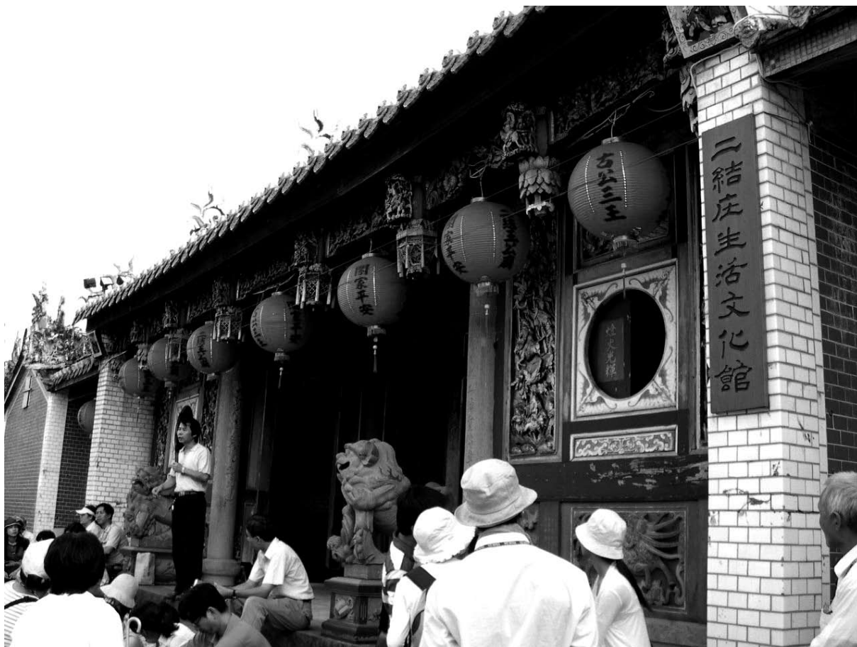
參訪大二結社區，汲取經驗