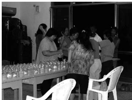
社區參與工作可由易到難，由淺至深一步步慢慢進行

當居民能加入社區組織成為社區志工，社區營造的工作才能順利推動。社區志工所參與的工作或改造行動範圍相當廣泛，舉凡社區環境的整潔與綠美化、景觀生態的營造維護、弱勢族群的福利保障、社區治安的維護、社區產業的推廣、衛生保健的提倡、宗教祭典的辦理、社區文史資料整理、以及社區教育活動的辦理等，都屬於社區志工服務的範疇。志工所能提供的服務若依性質來分，則不論是提供知識、技術、經驗、體能、時間或勞力的服務，或者提供器材、設備、資金且不求報酬，都是志工所能提供的服務類型。以下就介紹社區志工如何招募和經營的方法與技巧。