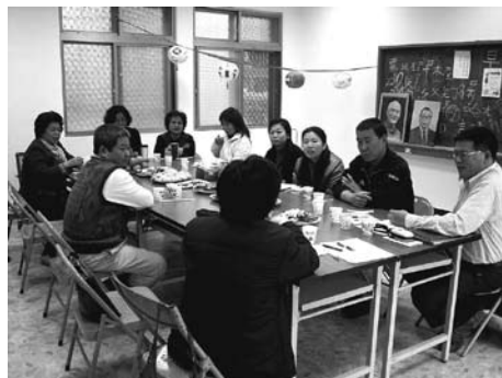
尊重每個人發言的意見，溝通才能順暢

在一個工作領域中，為維持融合的氣氛必須學會去聆聽工作夥伴的看法與觀點，才能夠擴大討論的範圍與參與面。有時，雖然夥伴的看法不盡理想或切中重點，我們