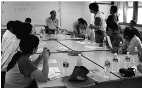
用心傾聽，溝通無距離