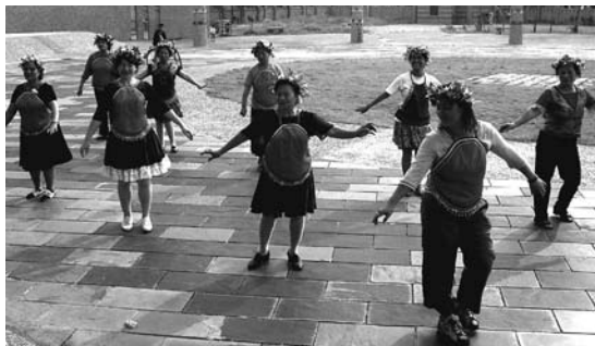
不管是理事長還是村長，大家一起翩翩起舞，其樂融融。

會在一個公平的起點上，尋求開放互信的人際關係，和大家一起思考、一同感受，這樣社區的工作氛圍將更為和諧。