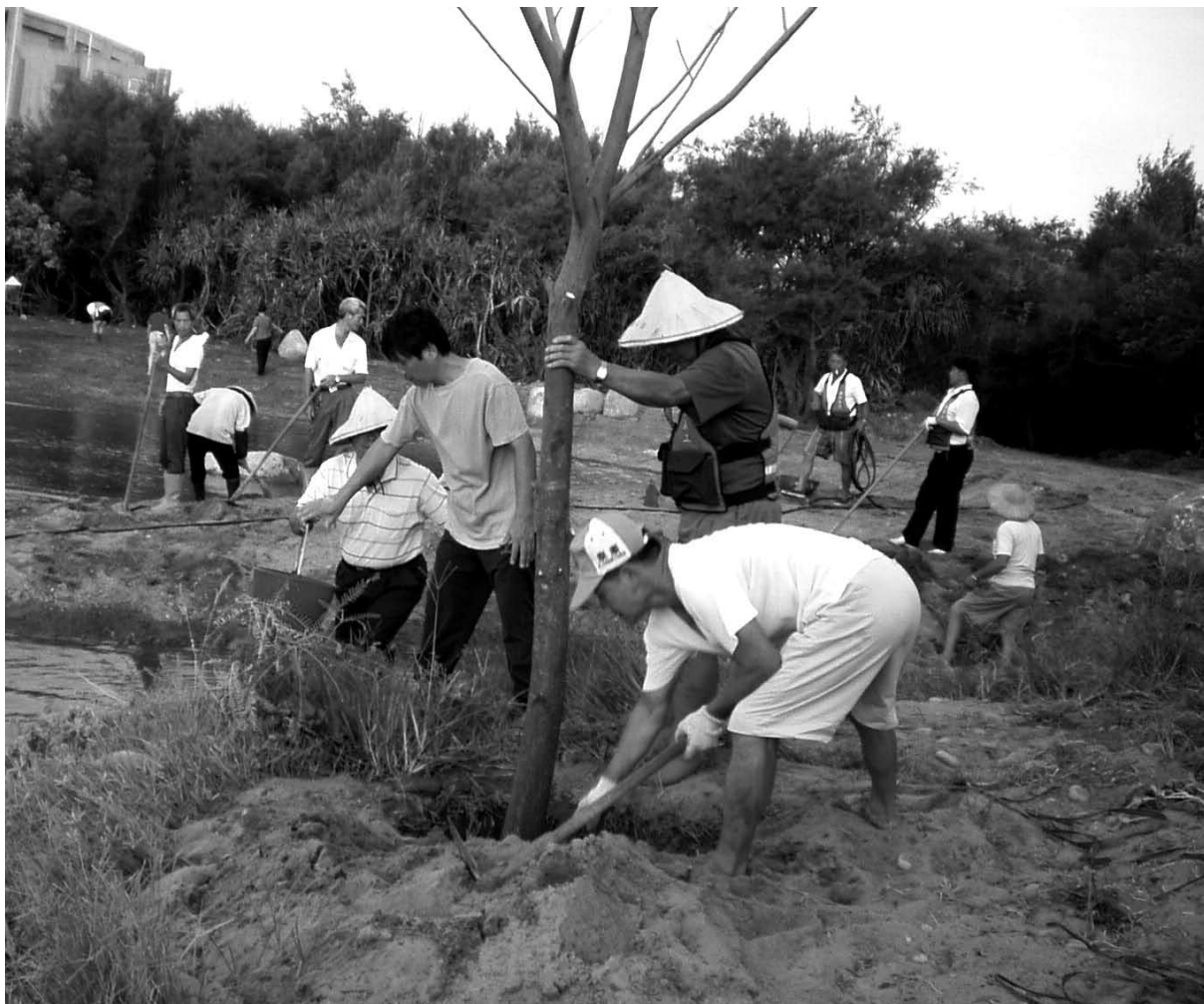
大家一起動手打造美好的生活環境－植樹