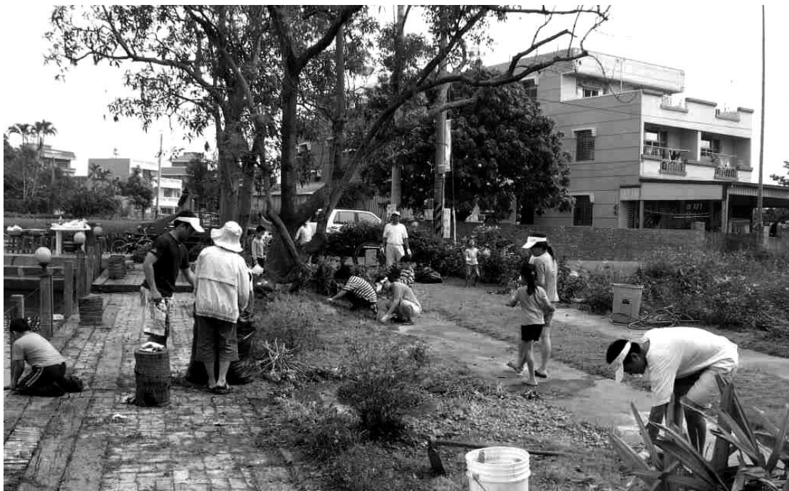
居民參與是社區營造的精神

居民參與是社區營造工作的重要精神，如果社區營造工作缺少了居民的參與，不過是另一種政府機關或地方派系力量的動員，大部分居民仍然只能被動地接受生活中的各項改變。居民參與社區活動的方式有很多，有積極主動參與社區公共空間規劃的討論，也有消極被動的只參與社區活動。很多社區組織領導人常常抱怨：「社區裡找不到年輕人參與、年輕人不願意參與社區事務、社區工作最後都只剩下理事長或總幹事等少數幾個幹部在做。」