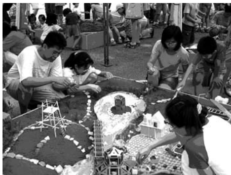
社區願景應是不分大小不分階級，透過大家的討論，行動中形成。

可是社區經常受不了資源的誘惑，有什麼計畫提什麼案，哪兒有經費就往那裡去，既缺乏策略，也缺乏計畫之間的關聯性，很忙，但不見得有方向，很累，但不知為何而戰，這樣子的狀況，當然無助於願景的形成。