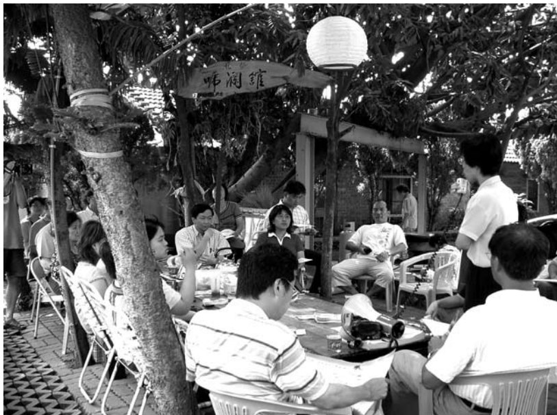
建立一個志工固定碰面交流的地點，可促進彼此的聯繫與交流

社區在營造過程會面臨不可預期的狀況或特殊議題，問題的解決需有專業背景、經驗或技術的人員加入工作團隊，才能一一克服，這時便需特地邀請社區內或社區外的專業人士來貢獻他/她的知識或能力。社區內可能存在社區文史、生態、景觀、各種產業等的專業人士，當組織在營造時缺乏專業知識和背景，或遇到瓶頸或困難，組織領導者就須三顧茅廬，邀請專業人士成為社區志工。