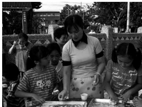
每一位參與活動者，都是事件的主角