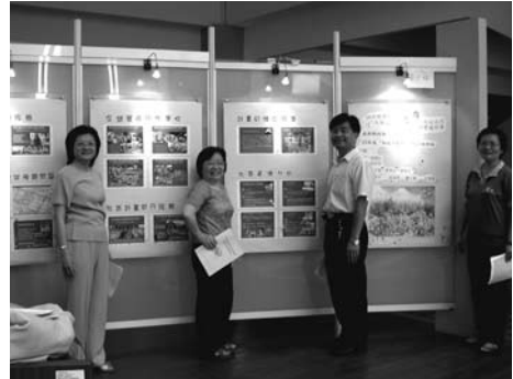
社區共識常來自共同學習過程的成就感。

社造中心是社造基本功的練功場，建議所有社區都應該至少參與一年計畫，同時這一年內不宜再申請其他中大型社區補助計畫(計畫經費20萬以上者)，專心、虛心地接受社造中心對團隊集體培訓，將能為社區儲備雄厚的社造能量。