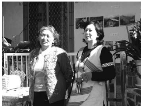
先行先做就是師父

在近幾年的社區與公務的工作推動過程中，可以看到許多社區與村里事務的分分合合、起起落落。其中有一點值得我們去觀察的是，一個整合能力強的社區團體，在工作指派與分擔的時候，它會盡量去考量每個成員間的經驗與背景，讓搭配的力量可以在工作進行中產生相乘的效果。所以這時候，就