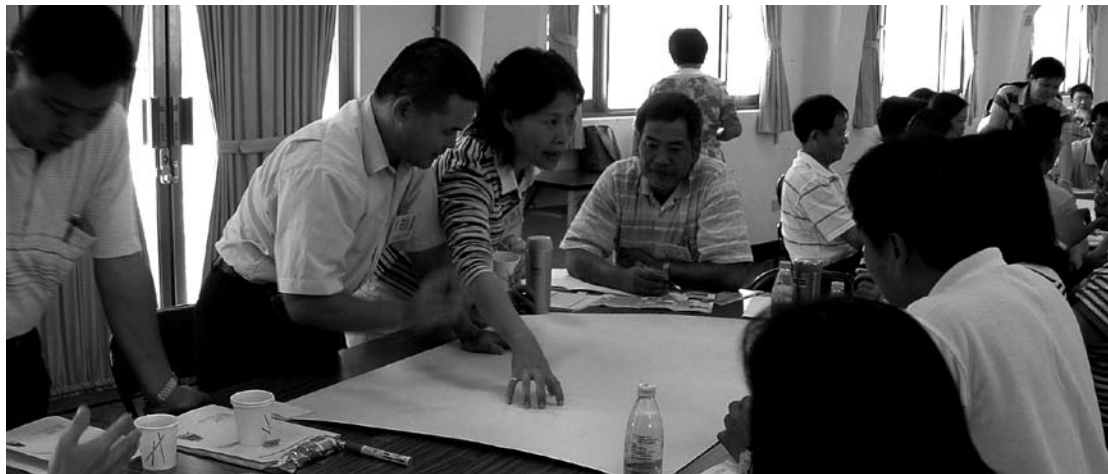
勾勒社區的願景藍圖

上述步驟比較是站在促成者的角度來看社區工作團隊的形成與運作過程，如果暫時沒有外來的社區營造協助者或協力團隊，那麼社區就可以從自我認識開始，也就是步驟3瞭解社區的資源與問題，然後再往下走。