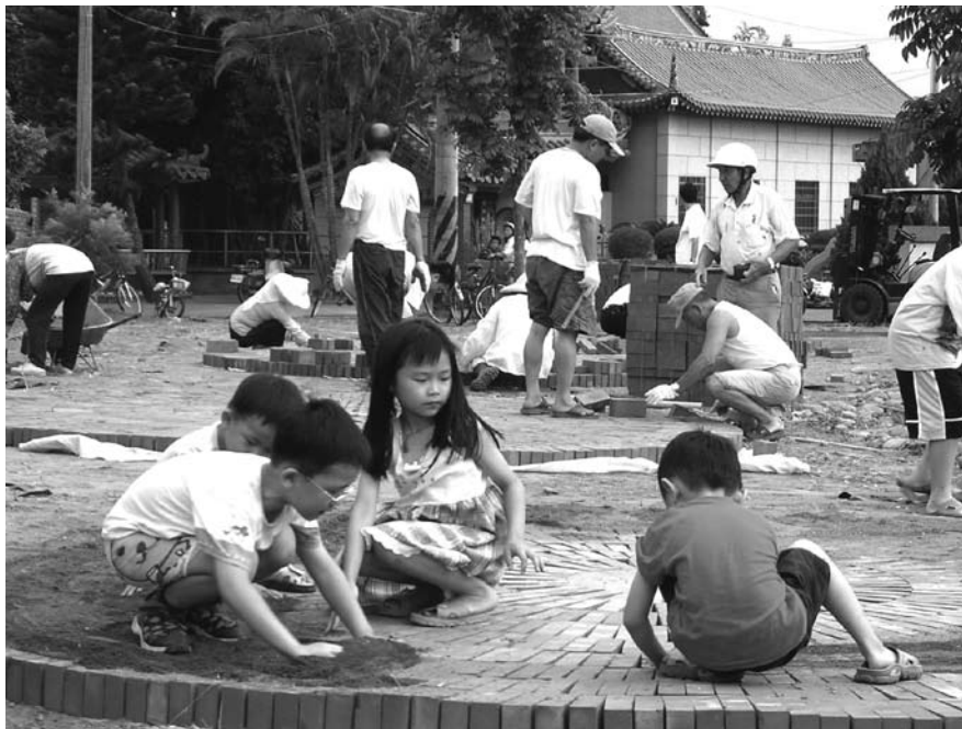
寓學習於遊戲，見證長輩的努力，孩子心中已種下愛鄉種子。

由參與活動中得到的獨特工作成果更進一步產生對社區的榮譽感，這種學習的發展進程會讓人上癮，參與者將逐漸內化為生活價值觀，這股力量將成為社區永續發展的動力。