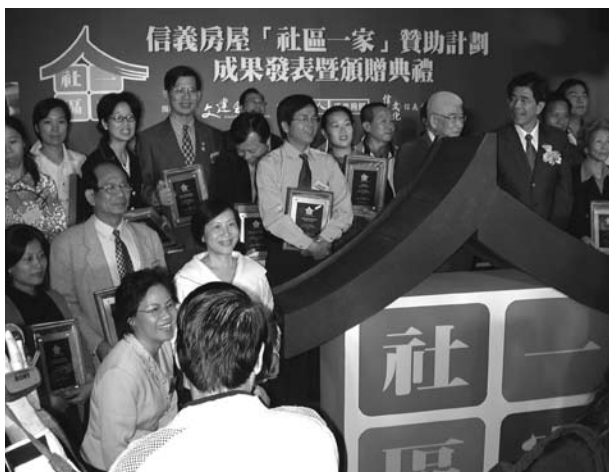
創造成就感，才能保持學習動力。

然而「居民參與」常因人多嘴雜而造成意見難以整合，「居民參與」其價值何在？為何社造領域一再強調其必要性？理論性的說法是，「居民參與是推動一切社區工作的基礎」，轉成白話文，就以社區資源調查為例說明，社區資源若委由專業者調查，將僅是人文地產景資源的條列，其呈現的成果常會令人失望，因為缺少在地化的觀點，社區資源很容易與鄰近鄉鎮雷同，社區居民沒興趣了解，當然無法激發社區認同。但若重新設計由居民自行調查，則會產生有趣的變化，例