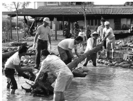
社區成長一起努力！

民國91年文建會成立北、中、南、東四區社區營造中心，緊接著民國92年開始，各縣市也在短短兩三年之間陸續成立社區營造中心，將社區輔導落實至社區最前線，同時各部會的各式計畫輔導團隊也大舉深入社區，社造儼然成為全民運動，社區學習資源也隨著社造業務化的發展而豐富多元。在這樣的蓬勃發展現象中，最值得稱道