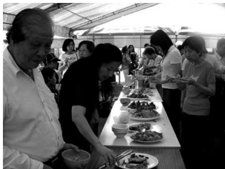
利用一戶一菜活動拉近居民情感

走入社區，特別安排了一場「你出菜我出菜」活動，動員社區裡近兩百名婦女，每人做一盤菜到廟埕廣場聚餐，大家除了彼此認識聯誼外，也踏出參與社區活動的一步。由以上案例便可以容易理解，社區動員的技巧不外乎讓每一位參與者，都是活動或事件的主角，而不是被到處使喚的小腳色。因此如何讓一件事情讓五個人來做，五個人的工作讓二十五個人來做，讓每一位參與者一起學習、一起成長、一起分享成果與榮耀，那麼在社區活動中就不用擔心再也找不到人。所以，身為活動或計畫的統籌腳色，就必須思考如何將一件簡單的事變複雜的操作策略，也是社區動員的基本概念。例如：社區舉辦活動，為了邀請長官、來賓或社區民衆參加，可能要寄發請帖邀請，通常大部分的社區思考的方式，不外乎將文案交請美工設計公司或印刷廠印製，再黏上收件人的地址由郵局寄送。但是如果懂得動員技巧，你也可能將請帖的文案交給學校，請學校將「它」當成美勞作業，讓孩子一起來做社區活動的請帖，每一位孩子必須將「它」帶回家請爸爸媽媽一起幫忙做。這個過程原本可能由秘書或社區組織某一個幹部，直接交代廠商印製即可，但是只要稍微改變一點策略，這個過程可能就有學校校長、老師、幾百位學生與家長的共同參與，參與的過程中除了知道活動時間、地點與內容，同時也讓學生與家長多一次認識社區的機會。